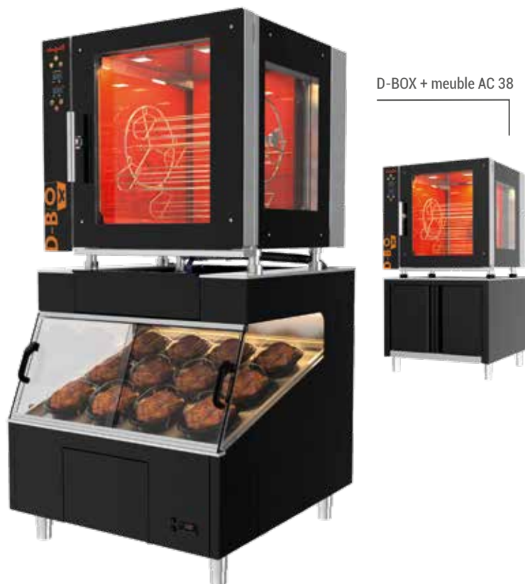
D-BOX + meuble AC 38